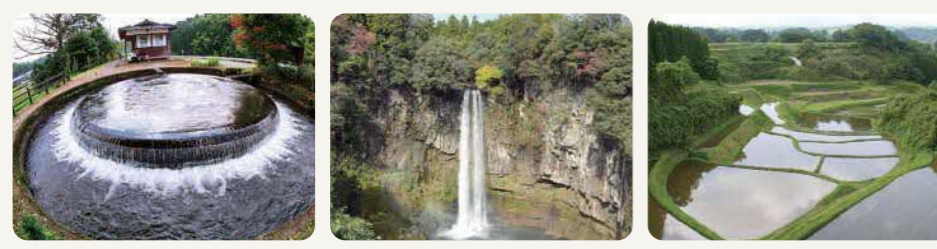
円形分水(分水施設) 五郎ガ瀧(五老ヶ滝) 白糸台地